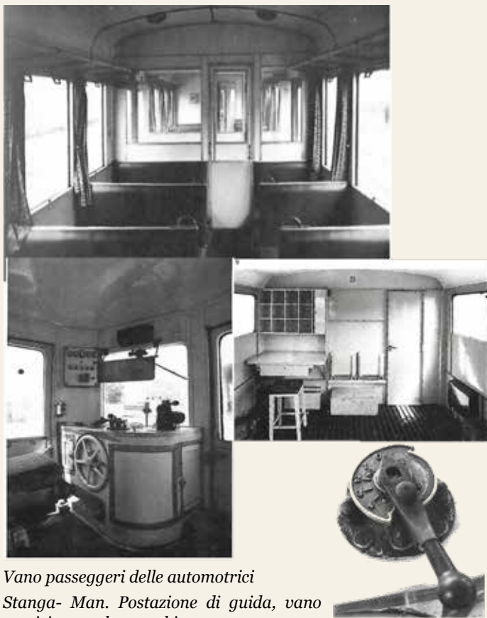
Vano passeggeri delle automotrici Stanga- Man. Postazione di guida, vano servizio postale e cambio a quattro marce

maggiore e Bologna-Massalombarda trasportarono 27.319 viaggiatori, di questi 4.076 in prima classe. 2.136.370 quintali di merci a carro e 99.980 quintali a collettame. Oltre a 5.871 capi di bestiame. L'indicatore della Provincia di Bologna del 1938 indicava le merci che transitavano dalla stazione di Mezzolara: canapa, barbabietole, cereali, uva, bestiame e riso. Numerosi erano poi i binari di raccordo. Tra questi, a Mezzolara con l'azienda Benni, a Molinella con lo zuccherificio e a Consandolo con dei magazzini frigoriferi. Nel 1938 la linea ferroviaria Bologna-Portomaggiore ebbe il seguente movimento: treni-km 318.064 con composizione di 80 tonnellate per treni viaggiatori e 300 per treni merci; viaggiatori-km 14.628.615; tonnellate-km 5.038.512.