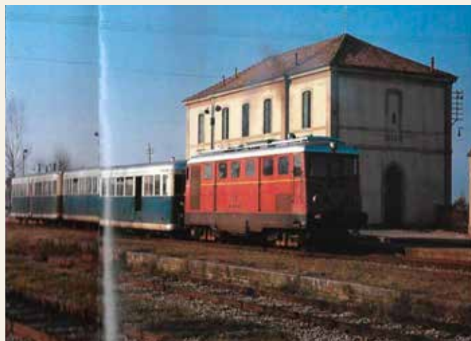
Locomotore De 424.01 con due rimorchiati alla stazione di Budrio

Nel 1936 la Società Veneta si era dotata di sei automotrici diesel costruite dall'Officina Meccanica della Stanga, con nuova numerazione: ADn 501-506 (A: automotrice; D: diesel; n: nafta). Lo scopo era quello di diminuire i tempi di percorrenza e le spese di esercizio rispetto alle locomotive a vapore. Queste macchine andarono a prestare servizio su altre linee della SV e non sulla Bologna-Portomaggiore. Sulla ferrovia Adria-Mestre queste automotrici riuscirono a dimezzare il tempo di percorrenza rispetto ai convogli a vapore. Le automotrici erano costruite sulla base di un collaudato progetto di automotrice "universale" della tedesca MAN Maschinenfabrik, le cui origini risalgono al 1758. La MAN produsse le prime rotative tedesche, il primo motore diesel e anche il carro armati Panzer V Panther, considerato dagli storici come uno dei migliori carri armati tedeschi. Queste automotrici avevano un motore diesel a 6 cilindri a 4 tempi a iniezione diretta con una cilindrata di 31.750 cm 3 in grado di fornire una potenza massima di 165 kW a 1000 giri/m. La trasmissione era meccanica con due alberi a giunti cardanici tra cambio e assi di un carrello. Il cambio era a quattro marce ad azionamento pneumatico. Tre nuove automotrici si aggiunsero nel 1938 mentre nel 1936 fu la volta di sette rimorchiati sempre costruite dalla Stanga (Cd 301-307). La capacità di posti a sedere delle ADn era di 80 posti. Simile quella delle rimorchiati.