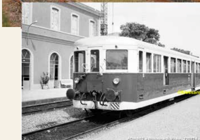
Locomotiva Stanga – Man numero ADn 507 e rimorchiato Cd 307. Luglio 1974. Nella foto in bianco e nero ADn 502

Mentre un manovratore che "continuamente in movimento colle macchine, lo vedete sfidare le intemperie, correre su e giù per le stazioni, slanciarsi col corpo fra i repulsori dei vagoni" prendeva 1,5 lire al giorno e si doveva pure pagare l'alloggio se nella stazione mancava.