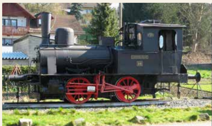
Locomotiva Borsig simile a quella in dotazione alla linea Bologna – Portomaggiore. Era la locomotiva n.330, gruppo 33.

La Borsig, fondata a Berlino nel 1837 da August Borsig, fu il primo costruttore in Europa e il secondo al mondo, con ben tredicimila locomotive a vapore realizzate.