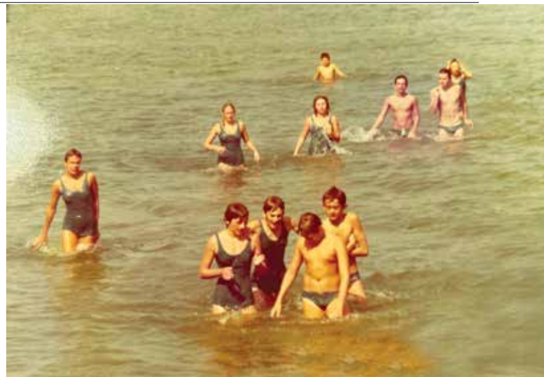
Sosta al lago di Balaton durante il viaggio verso Gyula: un'opportunità imperdibile per la squadra di nuoto di allenarsi nelle fredde acque del lago.

Cosa è rimasto di quella esperienza? Ho avuto l'opportunità di rifletterci e di ripercorrere quel viaggio, quando tre anni fa sono tornata a Gyula [ndr. l'autrice scrive nel 2006 e si riferisce al 2003, quando ricopriva il ruolo di assessora comunale ], questa volta a rappresentare la Giunta comunale. Ho cercato di ritrovare i luoghi e ho tentato di fare rivivere i ricordi e le sensazioni provate allora: le piscine e gli odori forti delle acque termali, il collegio dove eravamo alloggiati, le colazioni a base di salame piccante e cetrioli, i concerti di ocarina, gli scherzi e le risate, i timidi tentativi di allacciare rapporti di amicizia con i nostri "avversari", osteggiati dal nostro allenatore, quel filo di tristezza che mi aveva accompagnato allora, tipico dell'età adolescenziale. Nel frattempo molte cose sono cambiate e non soltanto io, ho trovato una città nuova, dinamica piena di giovani, di iniziative culturali perfettamente inserita nel nuovo contesto europeo (proprio in quei giorni si vota-