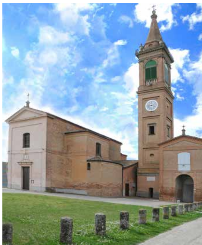
La Chiesa di S. Gregorio Magno

Anche quest'anno il gruppo promotore della festa si è riunito per condividere idee, proposte e scelte sul da farsi. Riguardo all'aspetto culturale l'intento è stato: