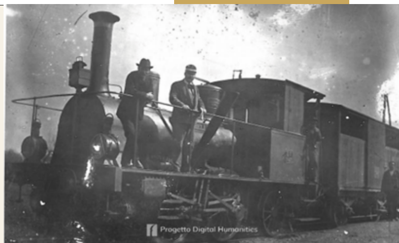
Locomotiva Esslingen n.57 in esercizio lungo la linea Bologna – Portomaggiore. Foto precedente al 1915

L'inizio del servizio avvenne con 34 corse giornaliere da Bologna per Portomaggiore e per Massalombarda. Si trattava per lo più di treni misti che avevano la composizione di 23 carrozze passeggeri e un paio di carri merci. Il parco rotabile era composto da 8 locomotive, 13 carrozze viaggiatori e 84 carri merci di vario tipo. Dal 1913 tutte le carrozze viaggiatori avevano il terrazzino esterno con cancello da aprire per scendere e salire e con pedane di transito tra una carrozza e l'altra. Ricordavano le carrozze del Far West. Le carrozze miste di I prima e II classe erano dotate di 16 e 20 posti rispettivamente, quelle di II classe di 40 posti e quelle di III classe di 58 posti a sedere. Nel dopoguerra, progressivamente fu eliminata questa divisione di classi. Nel